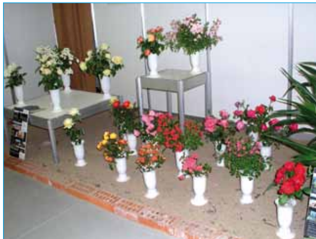
Růže z Lidic v Lysé

Na již tradiční výstavě Květy 2010 v Lysé nad Labem konané ve dnech 8. až 11. července jsme mohli obdivovat v pavilonu věnovaném ČZS vedle bonsajů a subtropických rostlin také řezané květiny. Védoucí lilie uprostřed pavilonu, ovšem i růže od třech vystavovatelů umístěné po obou stranách naproti sobě, byly nepřehlédnutelné.