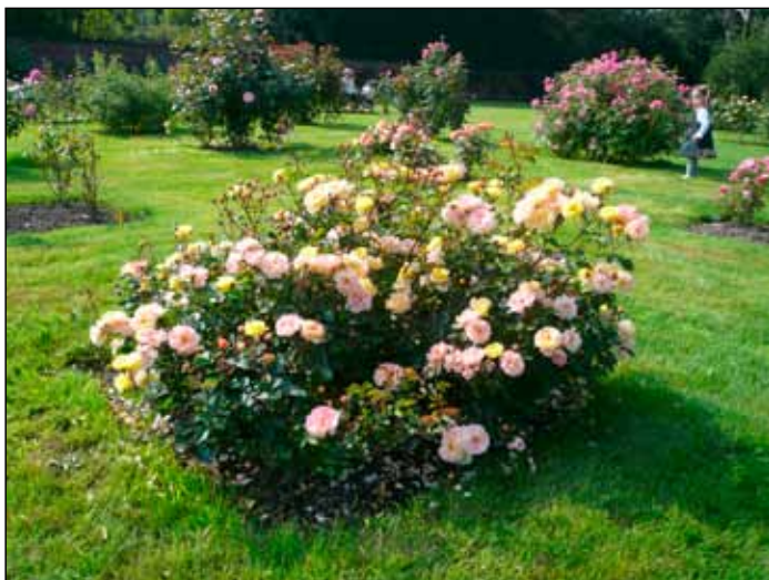
Růže byly ve vynikajícím stavu