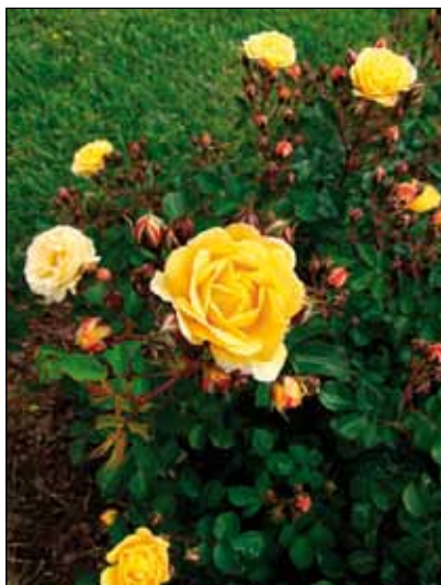
Zvláštní cena Barcelony za mimořádnou růži AM807 Alaina Meillanda

Dlouho jsem před odjezdem do Barcelony hledal uspokojivý popis Cervantesovy Růžové zahrady, až jsem uspěl na adrese: http://www.bcn.es/aparcat/en/aparcat_cervantes.htm