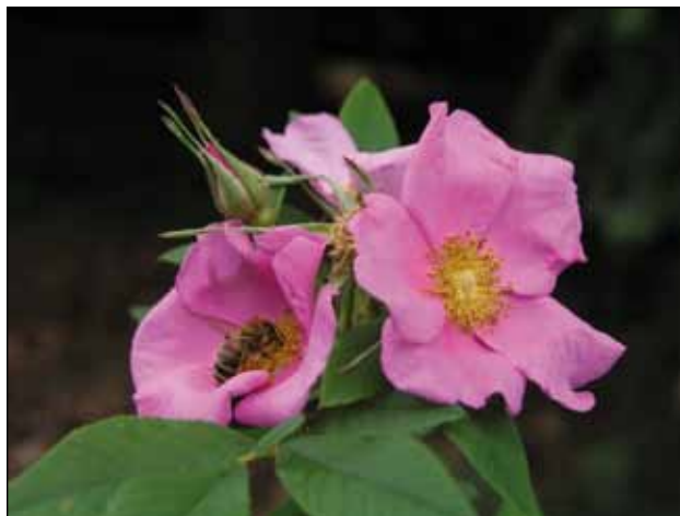
Rosa palustris ze Severní Ameriky

‘Aglaiia’, Schmidt 1896, běložlutá ‘American Pillar’, Van Fleet 1902, růžová ‘Boursault Pleine’, Laffay 1829, růžová ‘České Práci Čest’, Večeřa 1970, tmavě růžová ‘Dortmund’, Kordes’ 1952, červená ‘Elmshorn’, Kordes 1950, červenorůžová ‘Fragezeichen’, Bittner 1910, růžová ‘Geschwind’s Nordlandrose’, Geschwind, 1884, tmavě růžově fialová ‘Hiawatha’, Walsh 1904, růžová ‘Kassel’, Kordes 1956, červená ‘Köln am Rhein’, Kordes 1956, červená ‘Rostock’, Kordes 1937, růžová ‘Saarbrücken’, Kordes 1959, červená ‘Venusta Pendula’, Kordes 1928, bíle světle růžová ‘Wilhelm’ (syn. ‘Skyrocket’), Kordes 1934, červeně tmavě růžová ‘Trier’, Lambert 1904, bílá ‘Tropique’, Delbard, 1956, červená