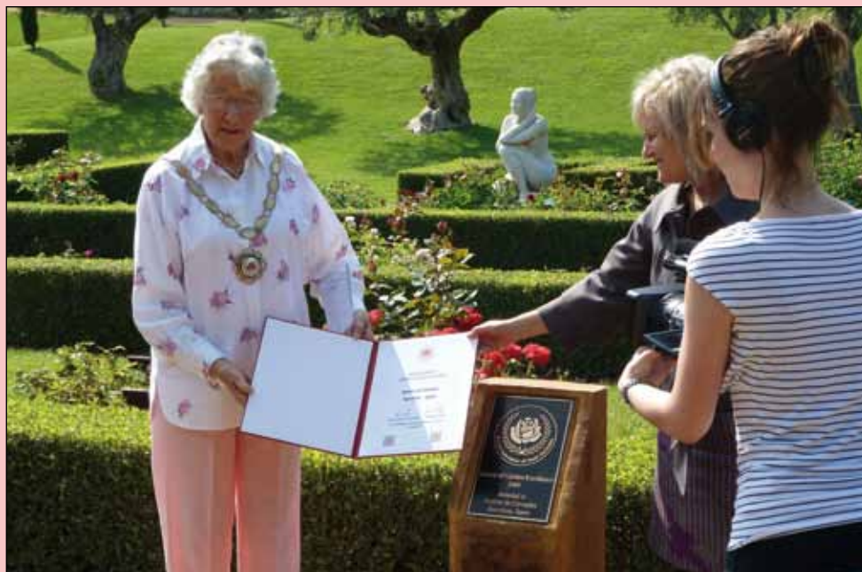
Garden of Excellence

K článku „Soutěž nových růží v Barceloně a Výstava růží v Sant Feliu de Llobregard“