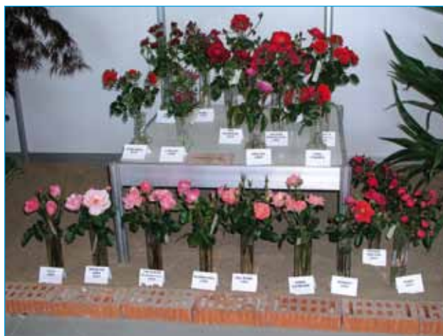
Růže z Chotobusu v Lysé

odrůdy a důraz zde byl zřejmě kladen na přiblížení různých skupin. České odrůdy zastupovaly růže šlechtitele Urbana z Želešic u Brna: světle růžový čajohybrid 'Lada' (1978), červená floribunda 'Lea' (1973) a červeně růžová velkokvětá floribunda 'Přelud' (1989). Z dalších je možno připomenout pěkné ukázky odrůd: světle červená floribunda 'Concerto', fialová miniaturní 'Cupido', tmavě růžový čajohybrid 'Klimentina', světle červená polyantka 'Orange Triumph', růžová velkokvětá floribunda 'Queen Elizabeth', červeně růžová floribunda 'Salmon Perfection'. Celkem se dalo napočítat asi 30 exponátů.