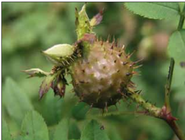
Rosa roxburghii z Číny

1937, bíle světle žlutá 'Frühlingsmorgen', Kordes 1941, růžová a bílá 'Frühlingsschnee', Kordes 1954, bílá 'Máňa Böhmová', Böhm 1925, bílá 'Milevsko', Večeřa, Látová 1980, růžová 'Nevada', Dot 1927, bílá 'Parade', Boerner 1953, tmavě růžová 'Pink Grootendorst', Grootendorst 1923, růžová 'Robin Hood', Pemberton 1927, růžová