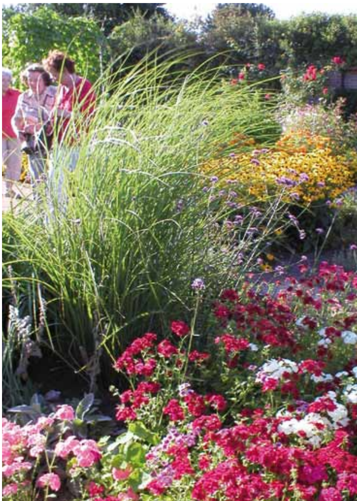
V klášterní zahradě

Poslední akcí bylo naše už tradiční Pozdně letní setkání našeho odboru, který by se podle účastníků měl jmenovat Praha a Střední Čechy. Koná se vždy v srpnu v klášteře v Řepích. Je koncipováno jako milé posezení s jedním ústředním tématem a popovídání o tom, co zajímavého jsme v létě navštívili, co zajímavého viděli, kam se ještě podívat a jaké růže které školky pro podzim chystají. Už na jaře jsem dostala nápad uspořádat také jakýsi workshop (kurz) na téma „Naočkujte si vlastní růži“, a nahrnkovala jsem hned koncem března 25 podnoží pro tento účel. V srpnu se zakořeněné převezly na setkání do Řep a akce začala. Pro většinu účastníků to bylo vůbec první praktické seznámení s očkováním. Zájem byl tak velký, že nebylo dost pravých očkovačů a bylo nutné si vystačit s ostrými kapesními nožíky. Na závěr si účastníci odnášeli domů vlastnoručně naočkovanou podnož. Pak už jim zbývalo jen zapustit ji i s obalem do země, na zimu zahrnout místo očkování a čekat na jaro, jak to dopadne.