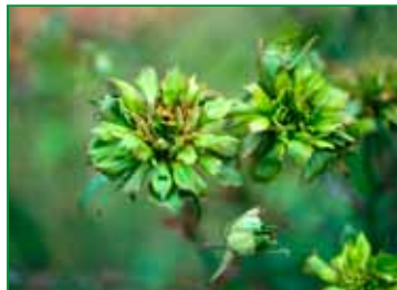
Rosa chinensis var. viridiflora