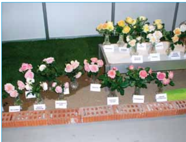
Růže ze Sobotky v Lysé

tvarů (anglické růže) uspořádané podle barev pěkně ladily. I přes určitou vzdálenost od návštěvníků toto místo opanovávala silná vůně. Byly zde k vidění např.: světle oranžová 'Crown Princess Margareta', světle růžová odrůda 'Emanuel', oranžově růžová 'Lady Emma Hamilton', tmavě žlutá 'Molineux', světle žlutá 'Teasing Georgia', bílá 'Winchester Cathedral'; některé další ukazuje naše fotografie.