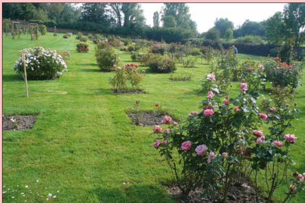
Kompozice soutěžního rozária u hospice sv. Jakuba v Le Roeulx K článku „47. ročník soutěže nových růží v Le Roeulx v Belgii“