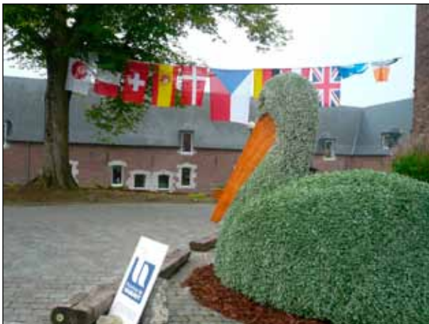
Česká účast se opravdu nedala přehlédnout

Popisovat celou cestu by nemělo význam, podstatné je, že jsme náš plán splnili a do Le Roeulx jsme ve čtvrtek 2. září v odpoledních hodinách dorazili. Hned jsme potkali i přátele růží, kteří nám ukázali cestu k penzionu, kde jsme měli rezervované ubytování. Díky tomuto prvnímu setkání jsme měli možnost okamžitě poznat velkou srdečnost a vstřícnost lidí, kteří zde žijí, srdečnost, která doprovázela všechny naše další kroky. Samotné městečko s převážující typickou cihlovou zástavbou má i přes svoji malou rozlohu hned několik pozoruhodností. Jsou jimi například budova původně sloužící jako nemocnice ve 12. a 13. století, která byla později přebudována ve školu, kostel jako jedna z dominant postave-