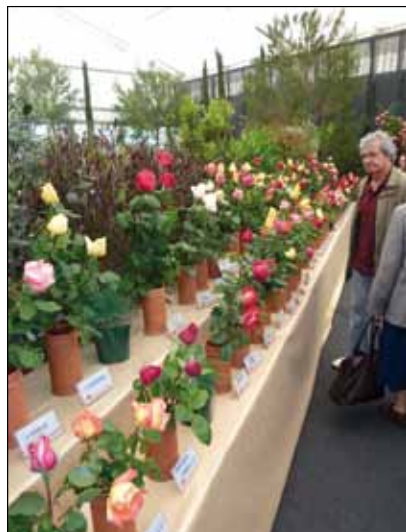
Jedna ze šesti řad vystavených růží ve stanu vedla zámečku v Sant Feliu de Llobregard