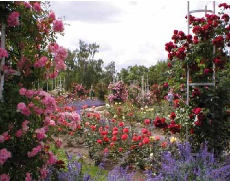
Petřín v květu