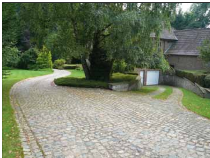
Zahrady ve městě byly mnohdy krásné

Večer byl příjemný, promítaly se snímky vítězných růží, diskutovalo a pilo pivo z místního pivovaru, jehož vlastníkem byl primátor města. Na hodnocení růží bylo pozváno celkem 77 účastníků z 11 zemí Evropy, dokonce i jeden zástupce z USA a jeden z Nového Zélandu. Jednalo se převážně o šlechtitele a pěstitele, představitele některých dalších evropských rosárií a zahrad či zástupce růžařských organizací jednotlivých zemí. Mezi čestnými hosty byl také princ Oli-