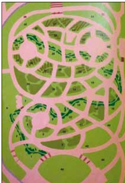
Schéma Cervantesovy růžové zahrady v Barceloně

Soutěžní rozárium se nachází v Cervantesově růžovém parku (El Roserar del Parc de Cervantes) na severozápadním cípu města, na konci Avenue Diagonal a křižovatce s Av. d'Esplugues, hned za sídlištěm s věžáky a bloky obytných budov. Leží na mírně se svažujícím terénu, má cca 4 ha, v rozáriu roste 10000 keřů asi 2000 odrůd, je rozděleno na 48 úseků s růžemi botanickým, s šlechtěnými dle skupin, ale i s růžemi významných šlechtitelů nebo s růžemi výrazně vonnými. Na vrcholu stojí mohutné pergoly s 233 různými pňoucími růžemi. Na čtyřech úsecích jsou za nízkým oplocením soutěžní růže. Park byl založen v roce 1965 podle návrhů architektů Lluisse Riudora a Joaquina Casamora. Soutěž růží byla zahájena v roce 2001 - i když soutěže růží se konaly v Barceloně už v letech 1926 a 1936. Vítězné růže v předchozích soutěžích byly od firem Jackson & Perkins, Warner, Harkness, Sauvegeot, Kordes, Meilland, Orard a Barni.