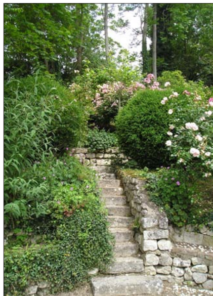
Giverny, rozárium za hostincem Baudy

Jak bývá obvyklé, nabízejí organizátoři mezinárodních konferencí před či/a po konferenci pro účastníky výlety, aby se účastníci mohli seznámit s významnými místy hostitelské země a při té příležitosti seznámili a v neposlední řadě též nalákali manželky/manžele účastníků konference k doprovodu. Nejinak v tomto případě. Předkonferenční dvoudenní výlet byl do Remeše a do Giverny, dvoudenní pokonferenční výlet byl do Paříže do Académie Française (jedna z akademií IF s prohlídkou Mazarinovy knihovny a další den do Malmaisonu, paláce císařovny Josefíny.