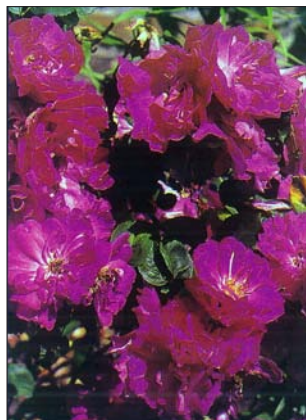
Desi Gulab = Gruss an Teplitz, Geschwind