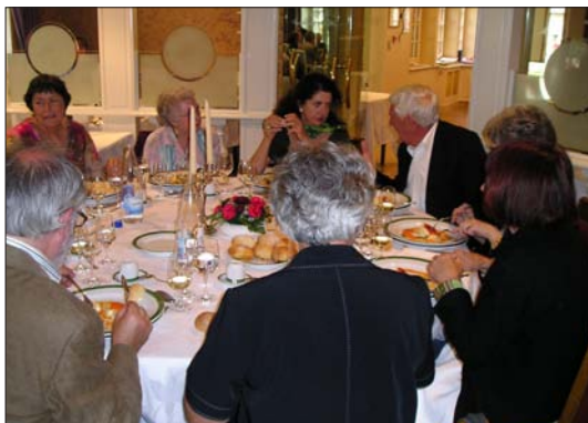
Commer, společný oběd se členy Rosa gallica