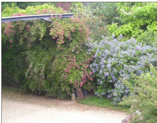
Compiègne, začátek loubí z růží