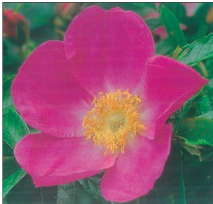
Rosa nitida , detail

Rosa nitida náleží do sekce Carolinae ; přirozený výskyt růží z této sekce se omezuje na území Severní Ameriky. Také areál růže lesklé se rozprostírá od Newfoundlandu na severovýchodě až po stát Ohio na jihu a území Velkých jezer na západě. Nalezneme ji tedy v provinciích Nova Scotia, Newfoundland a New Brunswick (Kanada) a ve státech tzv. Nové Anglie (USA). Větší část území přirozeného výskytu leží v Kanadě, v USA je již poměrně vzácná, v jižní části areálu výskytu je dokonce považována za ohroženou. V Americe se, podle doložených zpráv, pěstuje od roku 1807, není však zcela jasné, kdy byla prvně dovezena do Evropy (snad před rokem 1813 (Keskevič)); oblíbená je například v jižní Skandinávii.