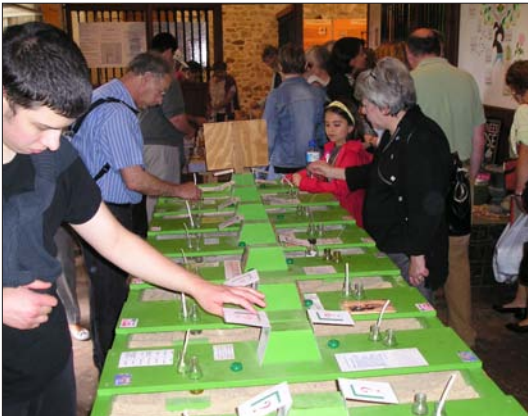
Vytvoř si svůj vlastní parfém - Festival růží

Byla to totiž právě ta doba, kdy do Evropy (zejména do Anglie a Francie) dorazily četné nové botanické druhy růží a jejich hybridy (čínské, multiflory, bankšovky, mechovky, portlandky, remontantky, noisetky), které výrazně oživily sortiment růží 19. století a Redouté ty první zachytil.