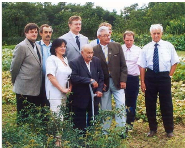
Rajhrad - Doočkovaná 2006, v první řadě

Celkový počet odrůd je tedy necelých 300 a je zde výhled na dalších 20 – 30 odrůd. Jedná se především o ty odrůdy, které jsou již zařazeny v rozáriích. Chybí nám ale novošlechtění