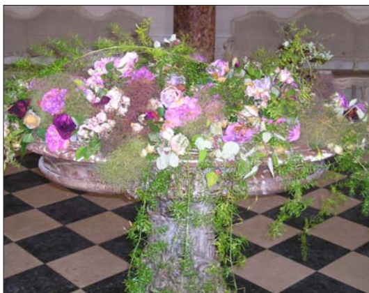
Chalis, výzdoba starými růžemi