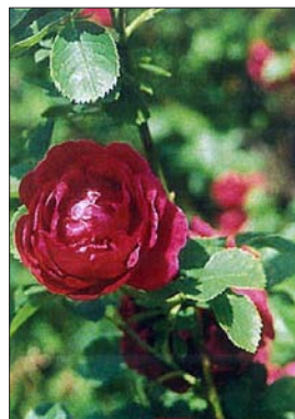
Zigeunerblut, Geschwind1890