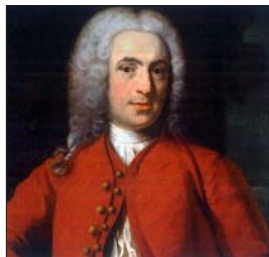
Carl von Linné