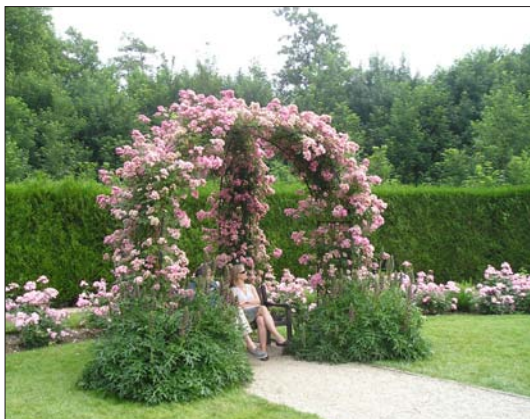
Rozárium v Chaalis, besídka z 'M.Silva-Tarouca' (Zeman)

– vyhledávat je - u starých usedlostí, na starých hřbitovech (např. židovských, v pohraničí), v opuštěných sídlištích (např. ve vojenských újezdech), na historicky významných místech (např. Růžový palouček, bojiště)