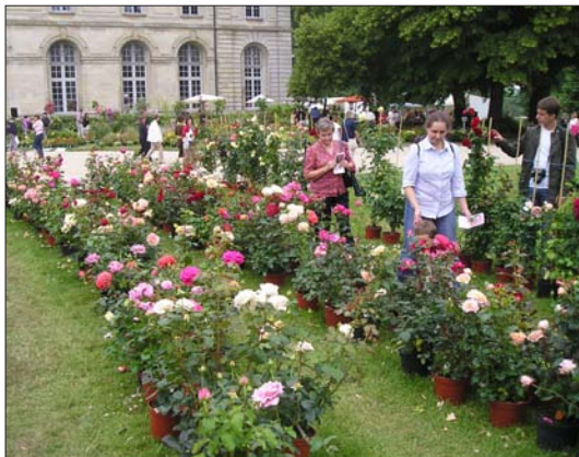
Prodej kontejnerovaných růží na Festivalu růží

Nepřišel jsem na vhodný název pro anglické heritage roses a pro názvy odnoží velké rodiny milovníků růží (Heritage Rose Foundation, Heritage Roses Group), protože růžařské dědictví, růžařský odkaz, růže z odkazu, růžařská tradice, tradiční růže, růže z minulosti apod. mi nezní dobře, i když jde o to, že naše současné růže skutečně podědily vlastnosti těchto starých růží. A termín staré růže není příliš výstižný (může třeba navodit dojem, že jde o růže staré třicet let, jistě úctyhodné stáří keře na zahradě). Používám tedy termín historické růže zavedený již dávno pro růže vyšlechtěné před rokem 1867, kdy francouzský růžař Guillot uvedl na trh první čajohybrid 'La France'. Do těchto heritage roses se ovšem zahrnují nejen tzv. Staré zahradní růže, ale i růže botanické a jejich hybridy.