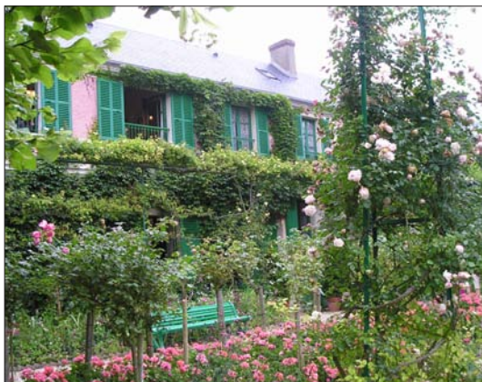
Giverny, Moneteův dům v záplavě růží a květin

Nechyběly ani knihy (konvenční i drahé, umělecké), výšivky, dekorační předměty. Občerstvení bylo zajištěno. Zajímavé bylo, že větší nákupy (třeba stromkové růže v kontejnerech) vozili mládenci a děvčata na trakařích k autům zákazníků za plot areálu. Na vlastní kůži jsme poznali, že s veřejnou dopravou ke klášteru (a to je naproti zábavný park) je to tu slabší, ale parkoviště byla přečpaná. Potěšila nás propagační brožura Parky a zahrady Pikardie – 98 stran se stručným popisem asi 80 zahrad a parků departementu Pikardie na sever od Paříže, vždy s internetovým odkazem na další informace.