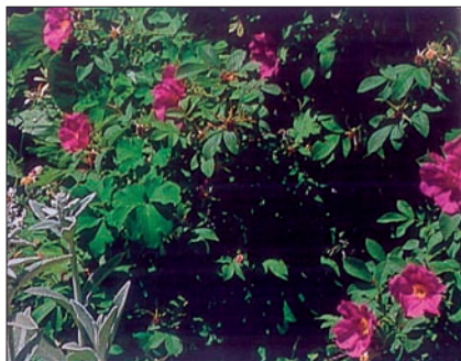
Rosa nitida , celek, foto Botanica's Roses

Keře růže lesklé jsou nízké, dosahují kolem půl metru, zcela mimořádně do metru výšky. Prýty jsou hustě štětinaté, s ostny světle hnědými, nejvýše půlcentimetrovými. Složený list má tři nebo čtyři jařma, lístky jsou nápadně úzké, podlouhlé a lesklé na lícni straně, s okraji charakteristicky pilovitě zubatými; palisty podlouhlé, neodstávající. Listy se na podzim barví do červená a posléze opadají. Růže lesklá kvete jednou, v pozdním červnu; jednoduché květy vyrůstají jednotlivě na žláznatých stopkách, mají růžovou barvu a znatelně voní. Nasazené šípky jsou kulovité, sytě červené, se žláznatými stopkami. Někdy je chybně zaměňována za růži virginskou a to především proto, že té se v některých jazycích také říká “lesklá”.