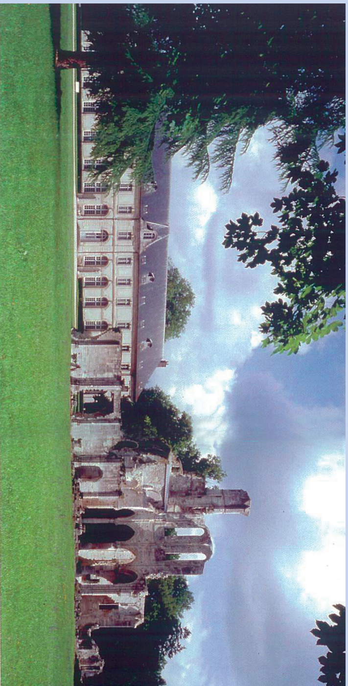
Částečný pohled na areál bývalého Královského opatství Chaalis, místo konání 1. mezinárodní konference o historických rúžích, vpravo zachovalý kostel, uprostřed ruiny kláštera, vlevo pobočka Institutu de France