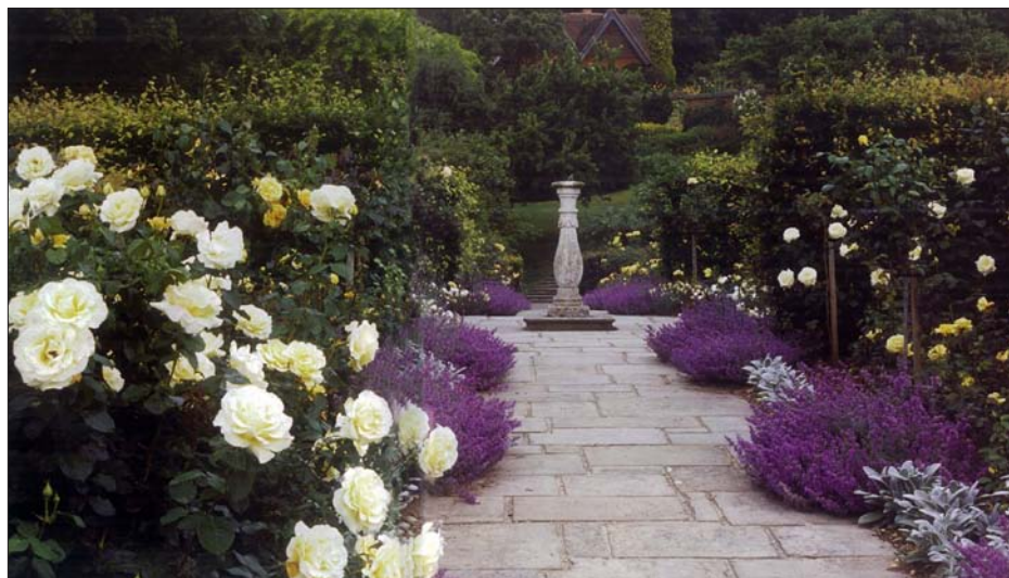
Zahrada Lady Churchill