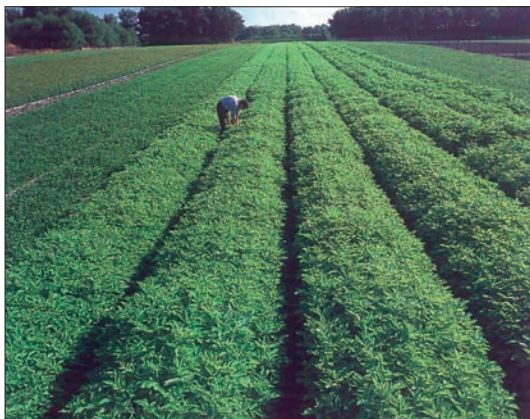
Pole podnoží