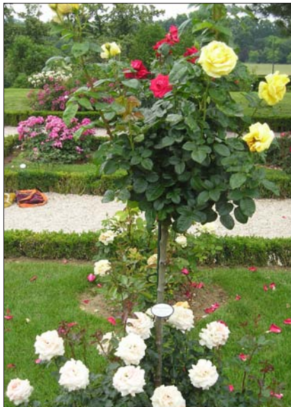
Bagatelle, rozárium, ukázka výsadby růží

Poznámka: V Abbeville, v okrese Crécy en-Ponthieu, existuje rovněž zámek Bagatelle s veřejně přístupnou zahradou kolem.