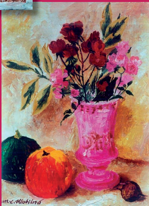
M. L. Hlobilová KYTIČKA RŮŽIČEK S PODZIMNÍMI PLODY 35 x 27 mm olej na plátně 2000