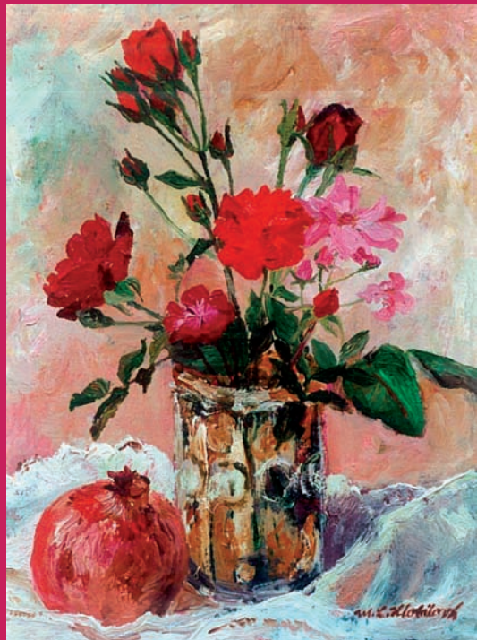
M. L. Hlobilová RŮŽIČKY S GRANÁTOVÝM JABLKEM 35 x 27 mm olej na plátně 2000