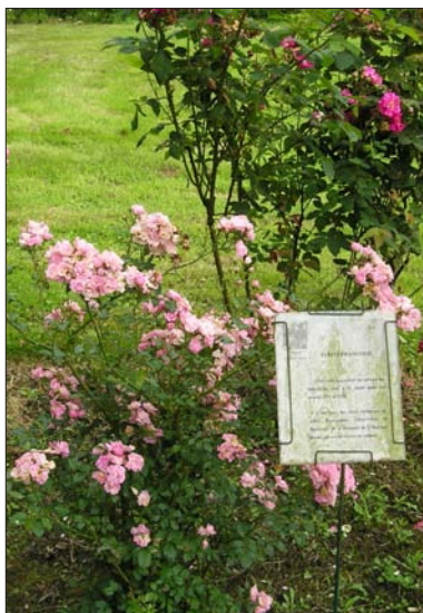
Commer, galika 'Petit Francois'